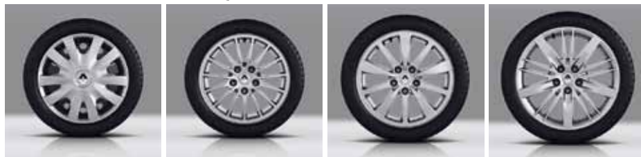
16" RATŲ GAUBTAI BAYADERE